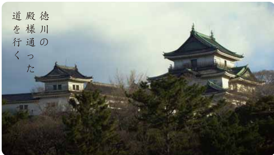
徳川様の道を行く