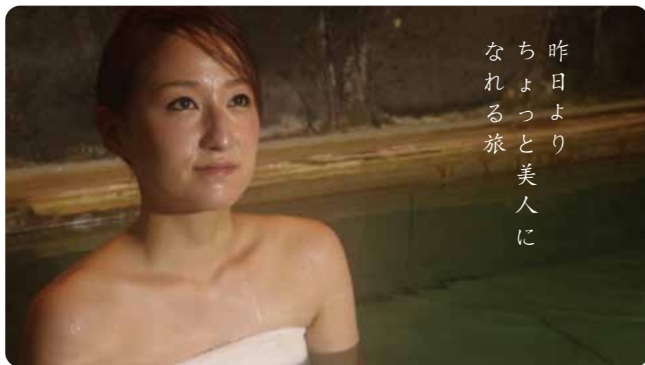
昨日より ちよっと美人に なれる旅