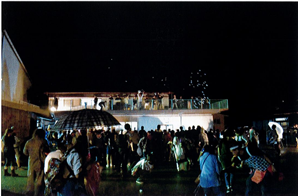
第3回龍神村ホタル祭り 夜のホタルもちまき 様子