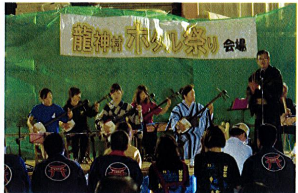
催事会場：三味線演奏