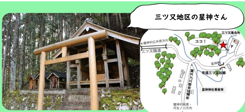
ミツ又地区の星神さん

龍神杉の割り箸(10膳)：165円(税込) 使い捨てにするのが勿体ない位、木の香りと質もいい一品です。