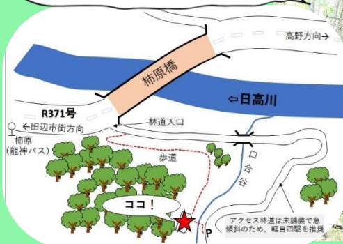
宮代地区の星神さん

まずは、龍神村ミツ又地区にあるミツ又星神、星神社(通称星神さん)です。元々は中国由来の星神「氏宿」像と「古武士」像の2体の祭神を祀り、災難厄除けの神として永く地域に信仰されてきました。しかし神社合祀により祭神は他の神社へ奉納され、現在は祭典も無くなり脇神の石山大明神とともに農業を象徴するご神体の杵(きね)が奉られています。ミツ又龍頭(りゅうず)という静かな山中の集落に鎮座する星神さんのご利益を求め、今もなお村外から訪れる方が絶えない一種のパワースポットとなっています。